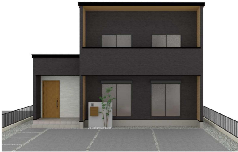
パースはイメージです。実際の建物と異なる場合がありますが、その場合は現況を優先とします。