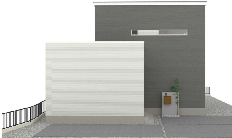
パースはイメージです。実際の建物と異なる場合がありますが、その場合は現況を優先とします。