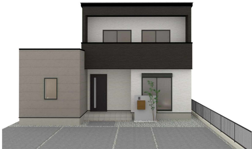
パースはイメージです。実際の建物と異なる場合がありますが、その場合は現況を優先とします。