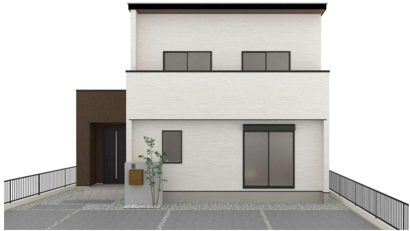
パースはイメージです。実際の建物と異なる場合がありますが、その場合は現況を優先とします。