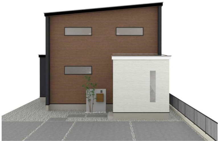
パースはイメージです。実際の建物と異なる場合がありますが、その場合は現況を優先とします。