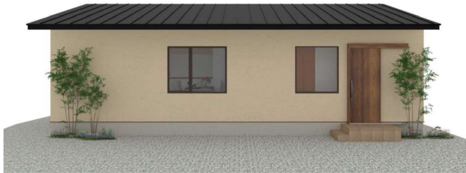
パースはイメージです。実際の建物と異なる場合がありますが、その場合は現況を優先とします。