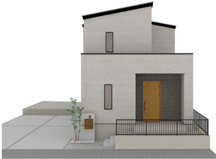
パースはイメージです。実際の建物と異なる場合がありますが、その場合は現況を優先とします。