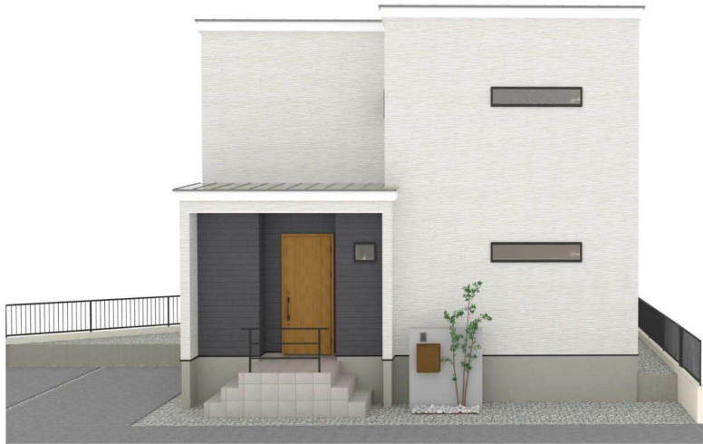
パースはイメージです。実際の建物と異なる場合がありますが、その場合は現況を優先とします。