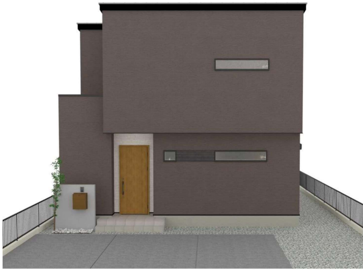
パースはイメージです。実際の建物と異なる場合がありますが、その場合は現況を優先とします。