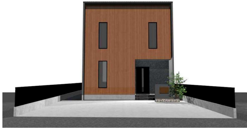
パースはイメージです。実際の建物と異なる場合がありますが、その場合は現況を優先とします。