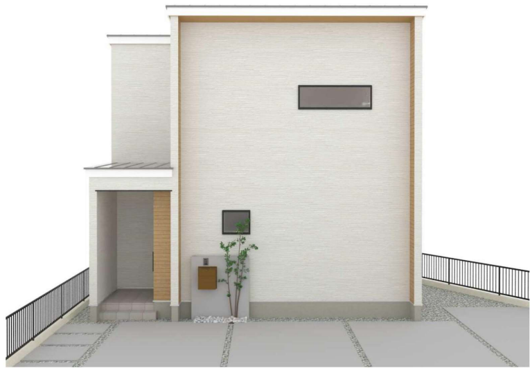
パースはイメージです。実際の建物と異なる場合がありますが、その場合は現況を優先とします。