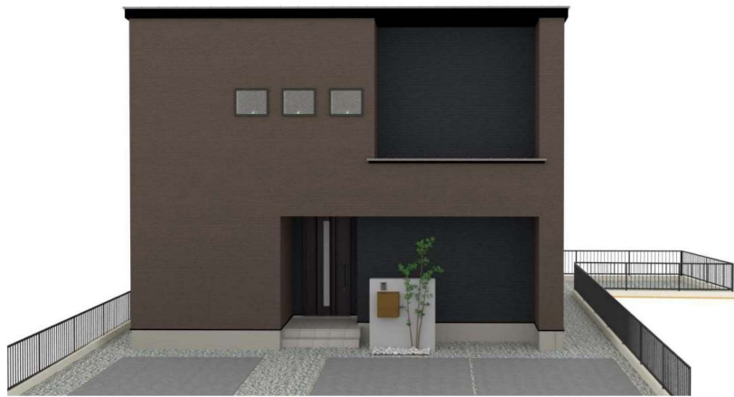
パースはイメージです。実際の建物と異なる場合がありますが、その場合は現況を優先とします。